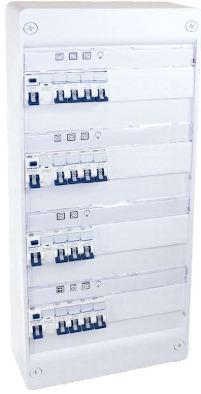
Tableau électrique monté-câblé pour T4 ou T5